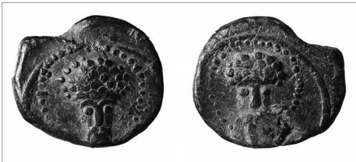
Пломба с изображением святых на обеих сторонах. Новгород, Троицкий XIII раскоп.