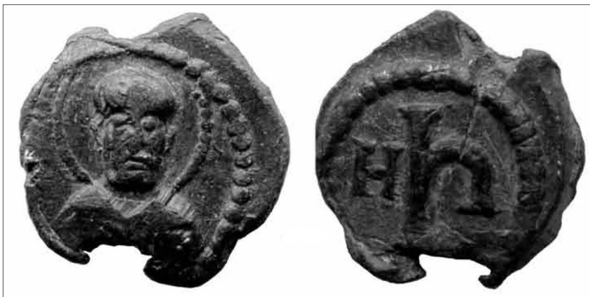
Пломба с изображением святого и княжеского знака. Новгород, Лукинский II раскоп.

По словам ученого, в западнорусских землях, не затронутых монгольским разгромом, активное бытование пломб могло сохраниться и позже XIII века. Возможно, именно с этим обстоятельством связаны значительные отличия пломб, найденных на территории Польши. Как установил петербургский исследователь Александр Евгеньевич Мусин, изображения на пломбах, найденных возле Дрогичино и Чермно, схожи с символикой монет князей из династии Пястов, правивших в середине XIII – первой половины XIV века. Возможно, на появление пломб в Дрогичине повлияли более ранние восточнославянские торговые пломбы, так как ни в Центральной, ни в Западной Европе такие свинцовые удостоверительные знаки не встречались.