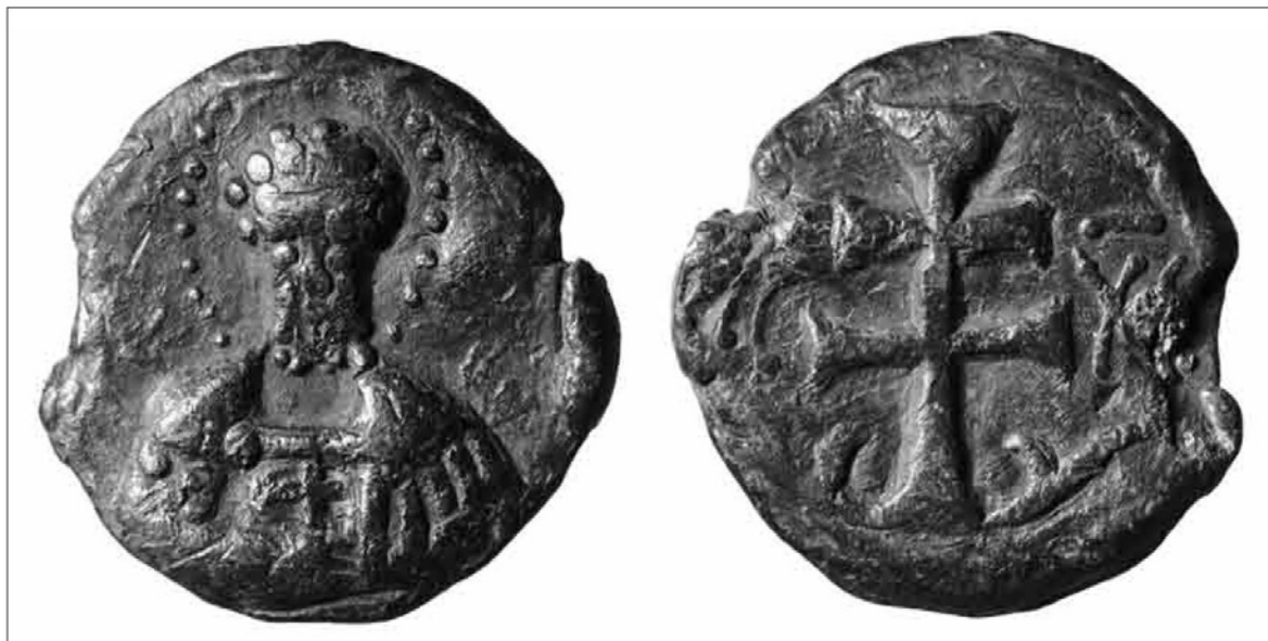
Пломба с изображением святого и креста. Новгород, Троицкий XIII раскоп.

древнерусских пломб стали исследования Валерия Борисовича Перхавко. В статье 1996 года и монографиях 2006 и 2018 годов историк собрал данные о 15 000 пломбах, из которых почти 12 000 зарегистрировано в Польше (80%), около 2500 – в Северной Руси (17%) и лишь около 450 (3%) – в западно- и южнорусских землях. За исключением Дрогичина, наиболее значительные серии пломб были зафиксированы в Новгороде (около 1000 экземпляров) и Городце на Волге (около 1600 экземпляров).